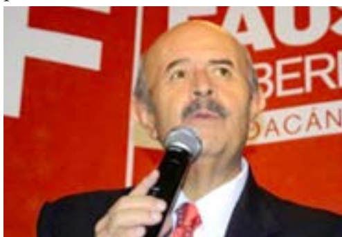
SILVANO AUREOLES CONEJO

El candidato común del Partido Revolucionario Institucional y del Verde Ecologista de México sostuvo que en la siguiente administración los recursos se manejarán con transparencia y honradez; será un gobierno con autoridad moral, con un gabinete de alto perfil encabezado por michoacanos que sepan hacer las cosas y con ganas de servir. Como ejemplo, en la Sedru estará como titular un campesino, y no "perfumaditos" que digan que saben mucho del campo y sólo se andan paseando.