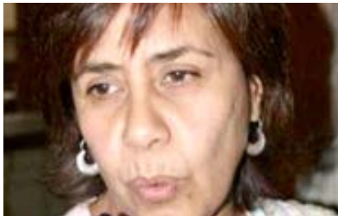
LUISA MARÍA CALDERÓN HINOJOSA

La candidata del Partido Acción Nacional, conocida como Cocoa, presentará el lunes su propuesta de gobierno por el periodo 2012-2016, en la capital de Michoacán. Economía, seguridad, salud, educación, campo, jóvenes, mujeres, indígenas y migrantes son los rubros en que girará su plan. Cocoa será respaldada por las aspirantes al 2012, Josefina Vázquez Mota y Santiago Creel Miranda, este domingo.