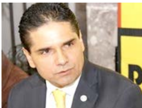
FAUSTO VALLEJO FIGUEROA

La candidata del Partido Acción Nacional, conocida como Cocoa, presentará el lunes su propuesta de gobierno por el periodo 2012-2016, en la capital de Michoacán. Economía, seguridad, salud, educación, campo, jóvenes, mujeres, indígenas y migrantes son los rubros en que girará su plan. Cocoa será respaldada por las aspirantes al 2012, Josefina Vázquez Mota y Santiago Creel Miranda, este domingo.