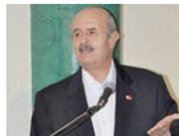
Fausto Vallejo Figueroa

Ante el incremento de gasolina ocurrido este fin de semana, el candidato de los partidos de la Revolución Democrática (PRD), del Trabajo (PT), Convergencia, lo calificó de "absolutamente reprochable", además, condenó al Gobierno Federal de haber incrementado un 500 por ciento la canasta básica sin que así ocurriera en el aumento al salario.