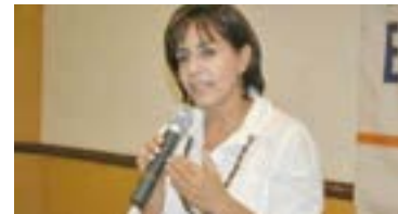
Luisa María Calderón Hinojosa

Luego de su promesa de crear una banda musical en cada escuela ya que "un niño que toca un instrumento nunca tocará un arma", la candidata del PAN ha sido respaldada por miembros del blanquiazul ya que "tiene los valores que se requieren para poner orden en el sector educativo, hacer que se cumpla la ley, abatir la impunidad y generar paz y concordia en el estado", declaró Vázquez Mota en su visita al estado.