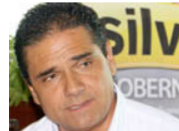
Silvano Aureoles Conejo

Luego de su promesa de crear una banda musical en cada escuela ya que "un niño que toca un instrumento nunca tocará un arma", la candidata del PAN ha sido respaldada por miembros del blanquiazul ya que "tiene los valores que se requieren para poner orden en el sector educativo, hacer que se cumpla la ley, abatir la impunidad y generar paz y concordia en el estado", declaró Vázquez Mota en su visita al estado.