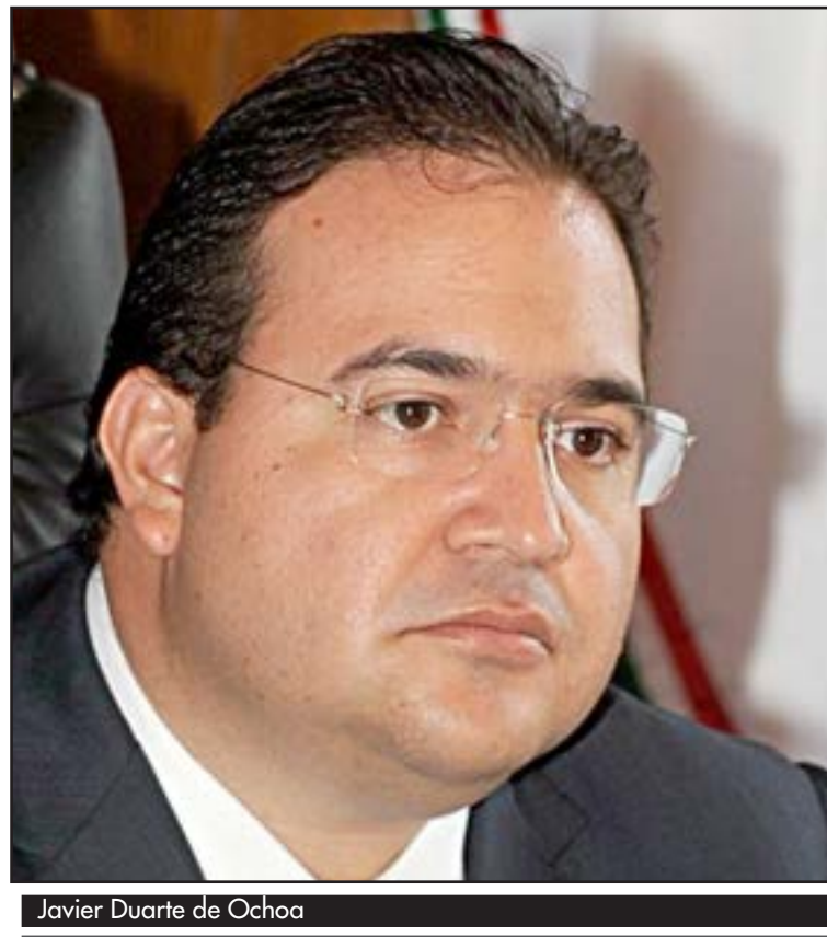
Javier Duarte de Ochoa

Como estrategia, la Tarjeta Informativa plantea: Una campaña para bajar al candidato del PRI y actual gobernador de la nube de popularidad, aprovechando que el tema de