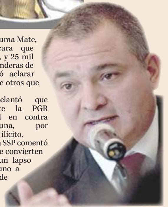
Genaro García Luna