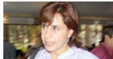
LUISA MARÍA CALDERÓN HINOJOSA

La candidata del PAN, conocida como Cocoa, aseguró que la principal demanda del estado es la seguridad, asimismo, prometió que someterá a un estricto control a las integrantes de su gabinete, quienes “deberán pasar el examen de confianza, exhibiremos las cuentas del gobierno a la población, además, habrá de revisarse el trabajo de los agentes policiales y de los Ministerios Públicos”, dijo.