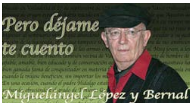
El poeta de la radio