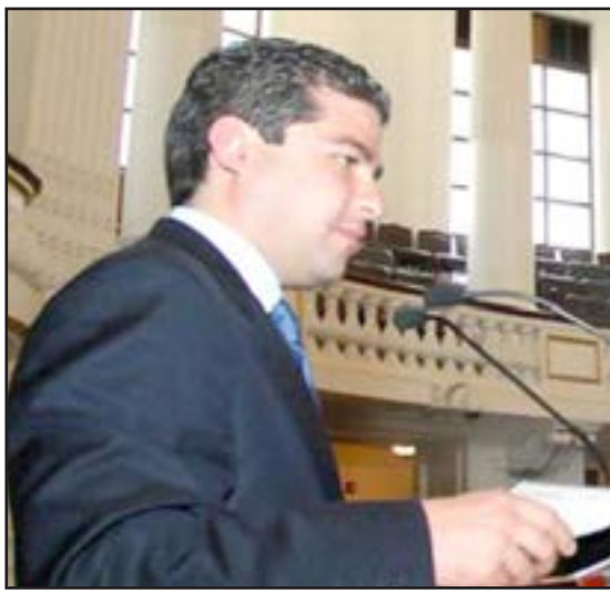
Mauricio Tabe Echartea

“Nos preocupa que a la fecha el GDF no tenga claro el camino que va a tomar ante la caída de los ingresos por