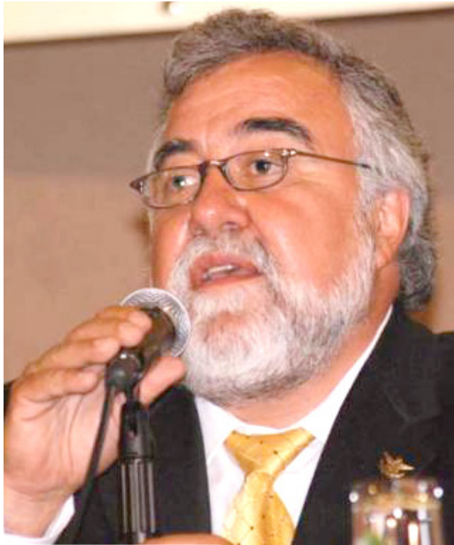
Alejandro Encinas Rodríguez

Rechaza que el PRI regrese a la silla presidencial, porque ni el PRI ni el PAN han demostrado que