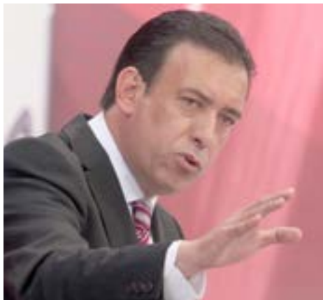
Humberto Moreira Valdés

Los priístas, dijo Moreira Valdés, somos orgullosos y dignos herederos de la Revolución Mexicana, hicimos de nuestros principios leyes, instituciones y, ante todo, realidades de libertad. Creemos en el PRI porque creemos en México, porque nadie mejor que nosotros conoce el valor de la libertad, de la unidad, del trabajo, de las