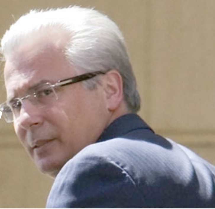
Baltasar Garzón Santibáñez