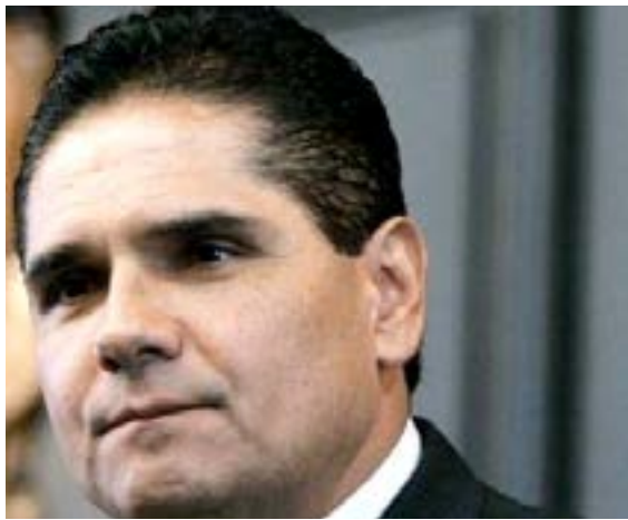
Silvano Aureoles Conejo

domingo y afirmó que se cuidará cada una de las casillas que se instalen.