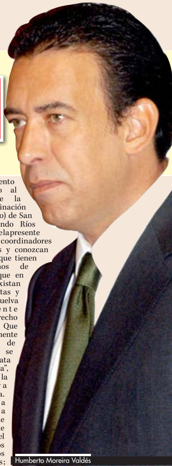
Humberto Moreira Valdés

El procedimiento que se demanda está marcado en los artículos 108, 109, 110 y 111 de la Constitución y en la Ley de Servidores Públicos en lo relativo a los delitos cometidos por servidores públicos. Además hay un acto de subversión porque se rompió el orden constitucional en Coahuila, pues se avala un adeudo hecho contra derecho, contraviniendo la propia ley vigente del estado respecto de la deuda pública, y la Constitución respecto de las normas que marca para que los estados puedan contraer deudas con cargo a sus ciudadanos.