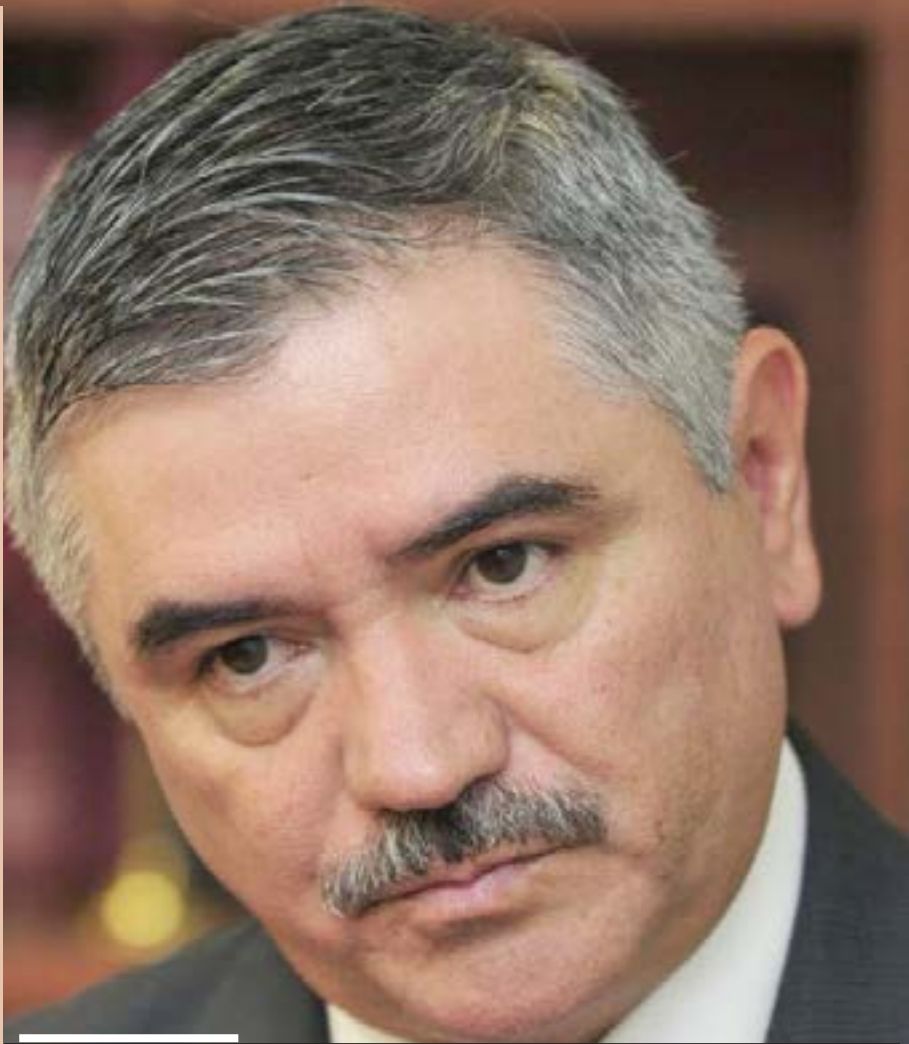
Leonardo Valdés Zurita

Porque debo recordarles que este presupuesto se elaboró a partir de un muy estricto ejercicio de planeación en el instituto, y hemos hecho un esfuerzo porque se trate de un presupuesto austero que incluye los recursos que son estrictamente necesarios para la correcta organización del proceso electoral, afirmó el consejero presidente del IFE, que por el momento es “muy prematuro hablar de