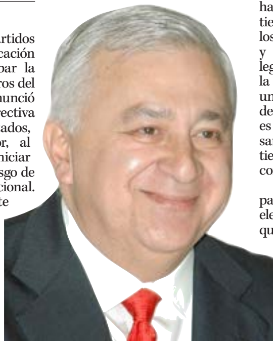
Emilio Chuayffet Chemor

Cuestionado sobre la validez se reponer el procedimiento de la elección de los tres consejeros faltantes del IFE, como lo propone el PRD en la Junta de Coordinación Política, Chuayffet Chemor aclaró "sí puede haber otro procedimiento, nada más que tiene que hacer facultades legales para emprenderlo, porque nadie puede hacer como autoridad lo que le venga en