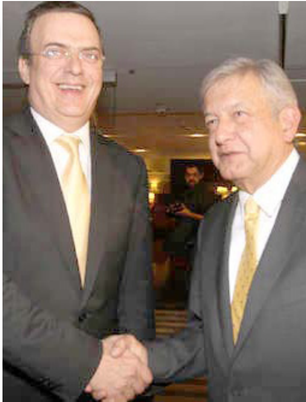
Marcelo Ebrard y Andrés Manuel López Obrador

Ambos legisladores reconocieron la postura de Marcelo Ebrard al aceptar la candidatura de López Obrador, "un