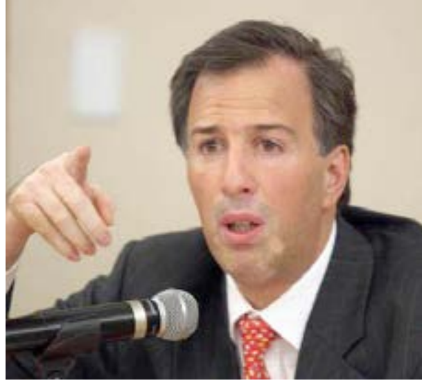
José Antonio Meade

Se destacó que las modificaciones propuestas al