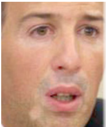
José Antonio Meade

Presupuesto 2012 dará certidumbre al país: SHCP