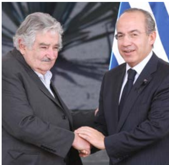
José Mujica Cordano (izq) Felipe Calderón Hinojosa (der)

Mencionó que Uruguay es el único miembro de Mercosur con el cual México tiene un Tratado de Libre Comercio y en tan sólo siete años de entrada en vigor del mismo, el intercambio comercial se ha triplicado, al pasar de 136 millones de dólares en 2003 a más de 441 millones de dólares en 2010.