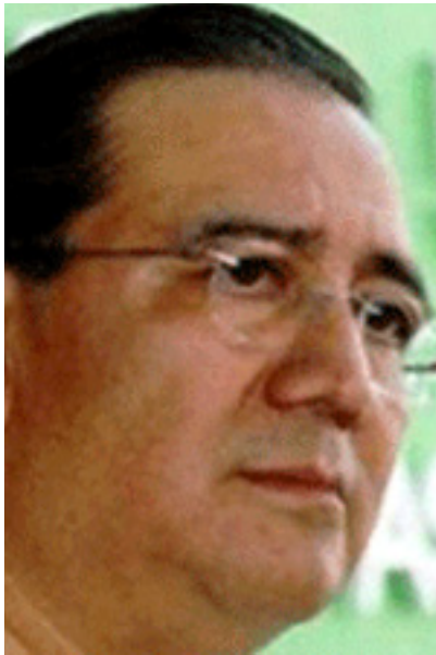
Pablo Salazar Mendiguchía

Según la procuraduría estatal, en el expediente se aportan elementos suficientes para acreditar que el ex mandatario estatal, Salazar Mendiguchía, en complicidad con diversos servidores públicos de su administración, desvió recursos del gobierno estatal por más de 100 millones de pesos. Entre las pruebas destacan testimoniales y peritajes contables y grafoscópicos que exponen pólizas de cheques,