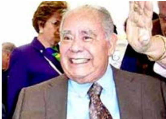
Carlos Jonguitud Barrios

Carlos Jonguitud Barrios, ex líder magisterial, falleció a los 87 años. El militante priísta, quien fundó Vanguardia Revolucionaria, antecedió en la dirigencia del Sindicato Nacional de Trabajadores de la Educación (SNTE) a Elba Esther Gordillo, quien fue llevada a ese cargo en 1989 a instancias del entonces presidente Carlos Salinas de Gortari.