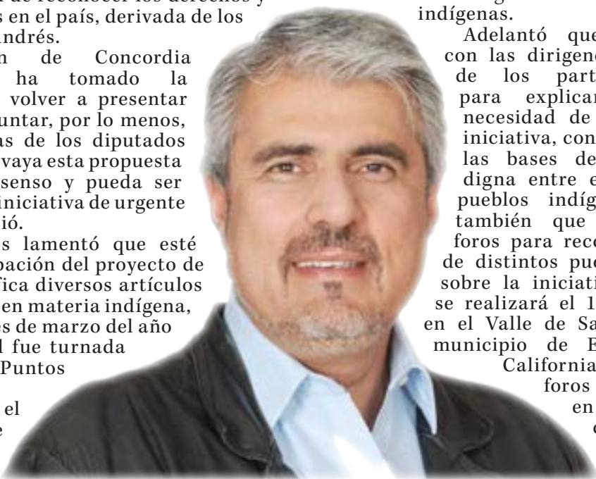
José Narro Céspedes

Adelantó que se reunirán con las dirigencias nacionales de los partidos políticos para explicarles sobre la necesidad de aprobar dicha iniciativa, con el fin de sentar las bases de una relación digna entre el Estado y los pueblos indígenas. Anunció también que se realizarán foros para recoger la opinión de distintos pueblos indígenas sobre la iniciativa; el primero se realizará el 11 de diciembre en el Valle de San Quintín, del municipio de Ensenada, Baja California; además, tres foros regionales, uno en la zona norte del país, otro en la zona centro y el último en Chiapas, en el municipio de Comitán.