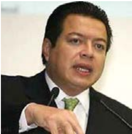
Mario Delgado Carrillo