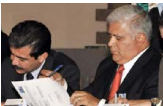
Directivos firman convenio

El Instituto Nacional para la Educación de los Adultos (INEA), y el Órgano Administrativo Desconcentrado Prevención y Readaptación Social (OADPRS), de la Secretaría de Seguridad Pública Federal firmaron un convenio para rehabilitar mediante la educación a las personas que se encuentran recluidas en los centros de readaptación social del país a nivel federal, estatal y municipal, por lo que prestarán servicios