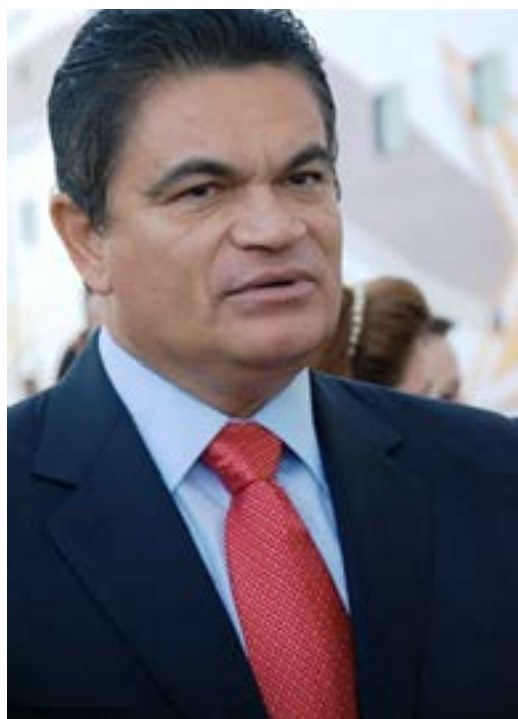
Mario López Valdez