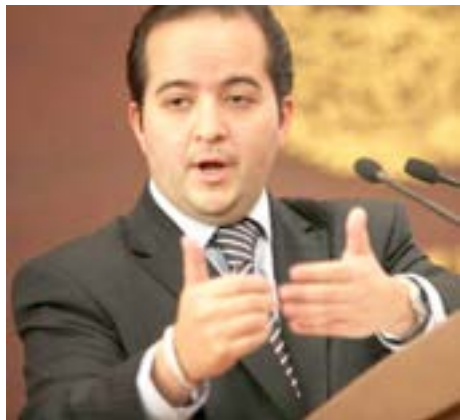
Alejandro Poiré Romero

Alejandro Poiré Romero, secretario de Gobernación, advirtió que la construcción de la seguridad auténtica, de la seguridad duradera que reclaman los ciudadanos de todo el país es, sin lugar a dudas, la tarea prioritaria del Estado mexicano en el Siglo XXI; es la preocupación más importante de la población en las encuestas de opinión pública, en su expresión en los medios de comunicación, en las conversaciones cotidianas; es la obligación básica, fundamental del Estado garantizarle a los ciudadanos su seguridad, su propiedad, su tranquilidad, el cumplimiento de la ley. En esa empresa, empresa crucial que explica la existencia