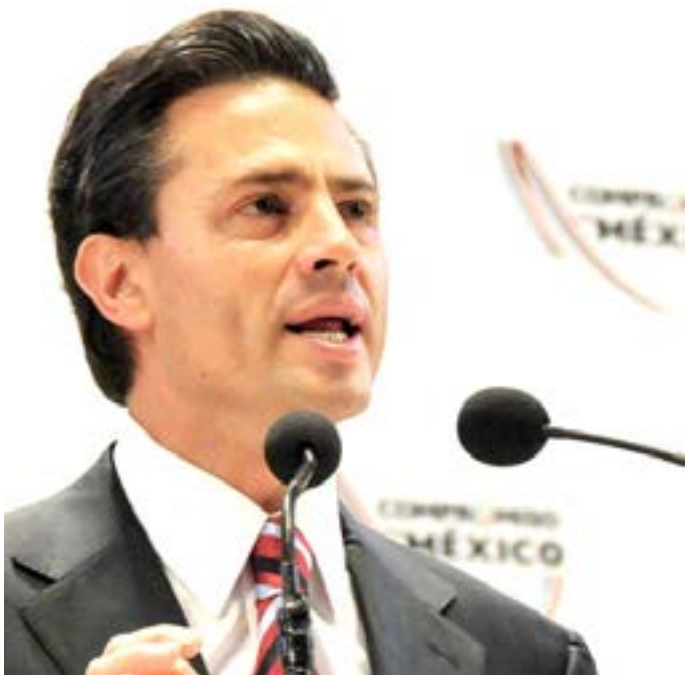
Enrique Peña Nieto

Así mismo refirió que "en esta contienda electoral el partido saldrá más fortalecido en su unidad interna, va a tener una ventaja importante", en cuyo caso, expresó, en el PRI esta unidad es de mayor trascendencia.