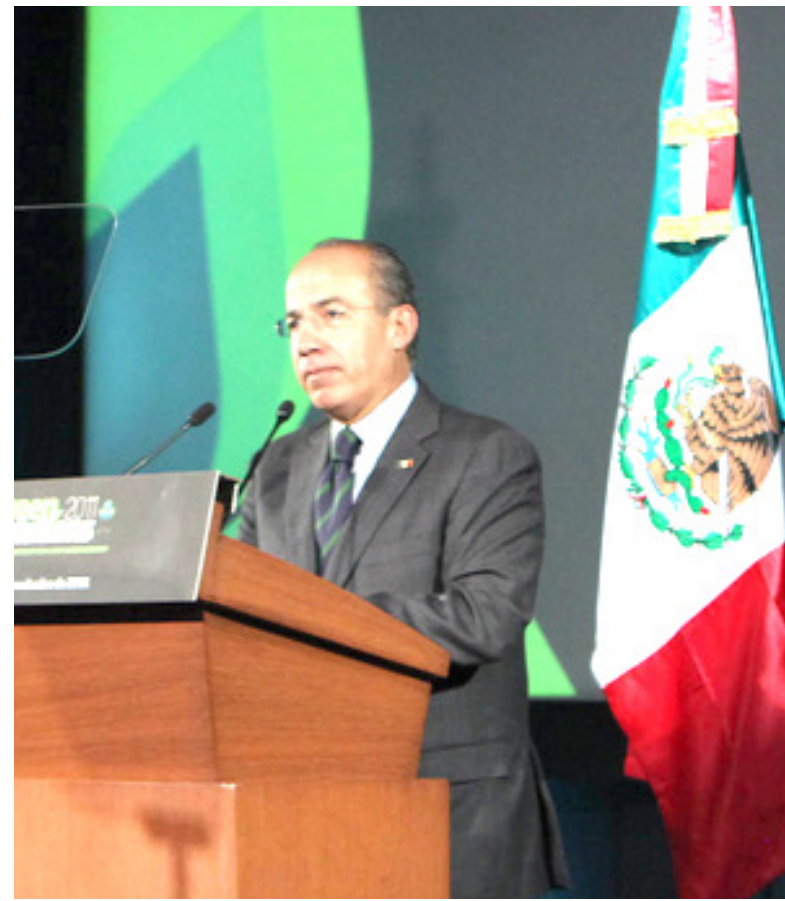
Felipe Calderón Hinojosa

Añadió que ello es bueno para el medio ambiente, pero también para las familias, porque pagarán probablemente 40 por ciento menos en su recibo de electricidad, y, a la vez, es positivo para el gobierno porque la mitad de la luz que se