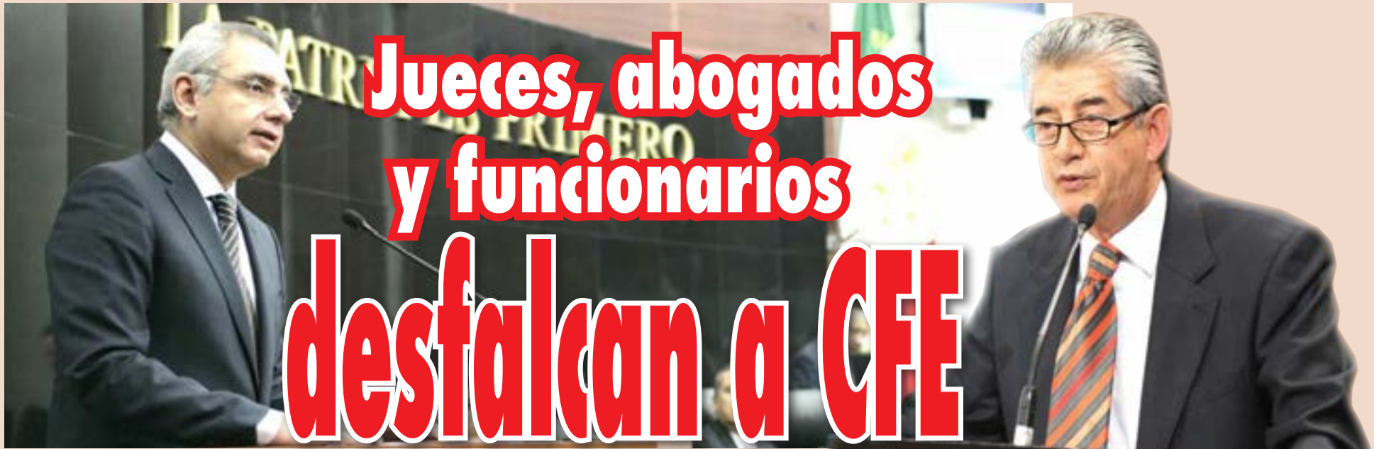
Salvador Vega Casillas