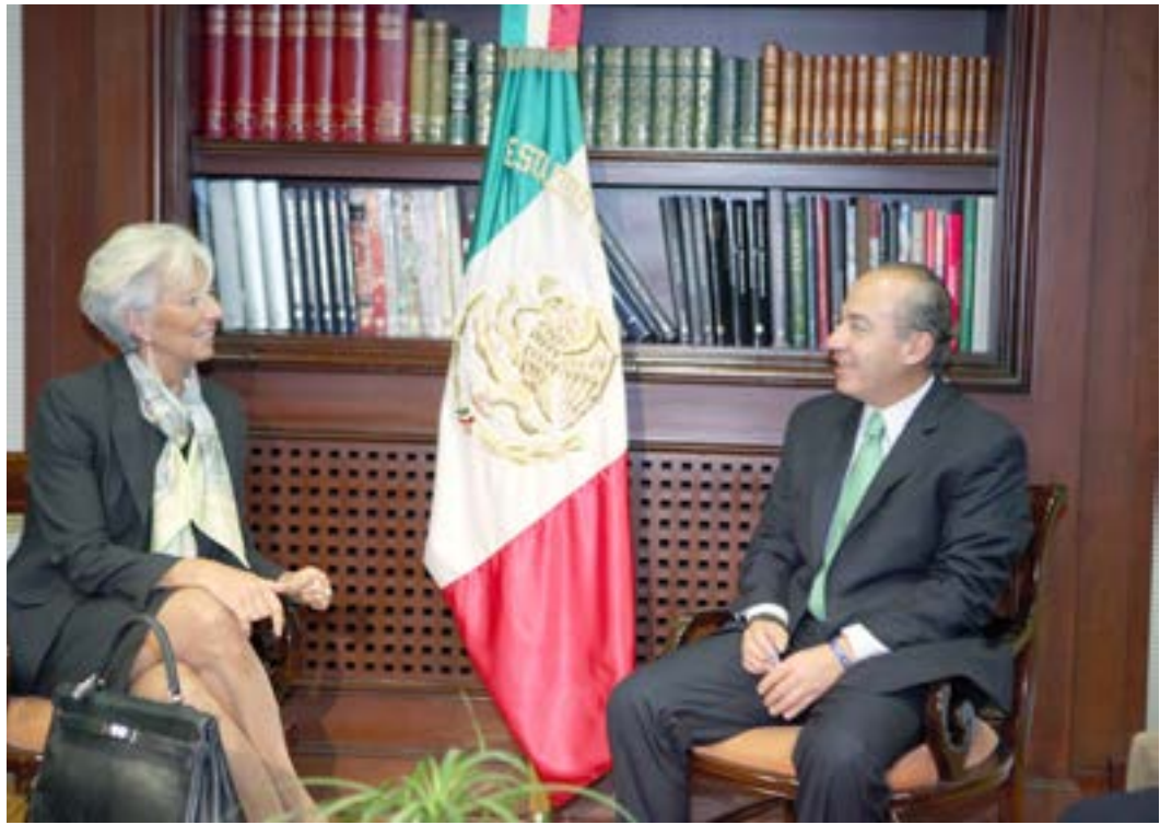
Christine Lagarde y Felipe Calderón

Calderón Hinojosa estuvo acompañado por el secretario de Hacienda y Crédito Público, José Antonio Meade Kuribreña, y el gobernador del Banco de México, Agustín Carstens. Mientras el director del Departamento del Hemisferio Occidental del FMI, Nicolás Eyzaguirre, acompañó a Christine Lagarde.