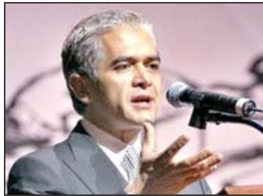
Miguel Ángel Mancera

que se pueda trabajar de manera coordinada, yo creo que uno de los pasos más relevantes, más rescatables de toda esta tarea es el conocimiento y reconocimiento del problema.