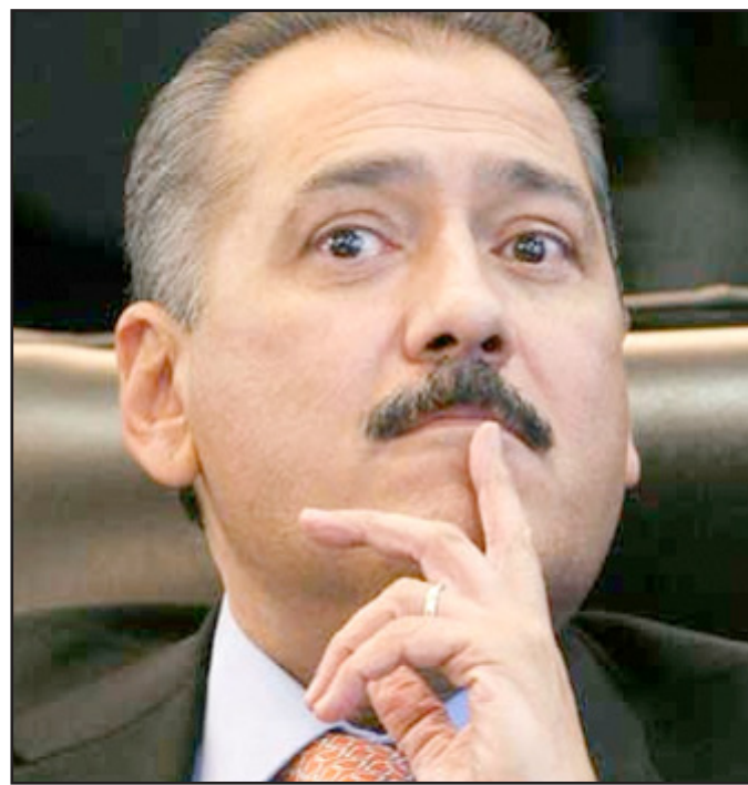
Manlio Fabio Beltrones Rivera

En reunión con el Grupo Parlamentario del PRI, el legislador priísta destacó que en materia de seguridad pública, se han establecido los instrumentos indispensables para continuar la lucha contra el crimen organizado transnacional, al aprobar la ley contra el lavado de dinero y la ley antisequestros, así como reformas constitucionales en materia de derechos humanos, migración y amparo, las cuales