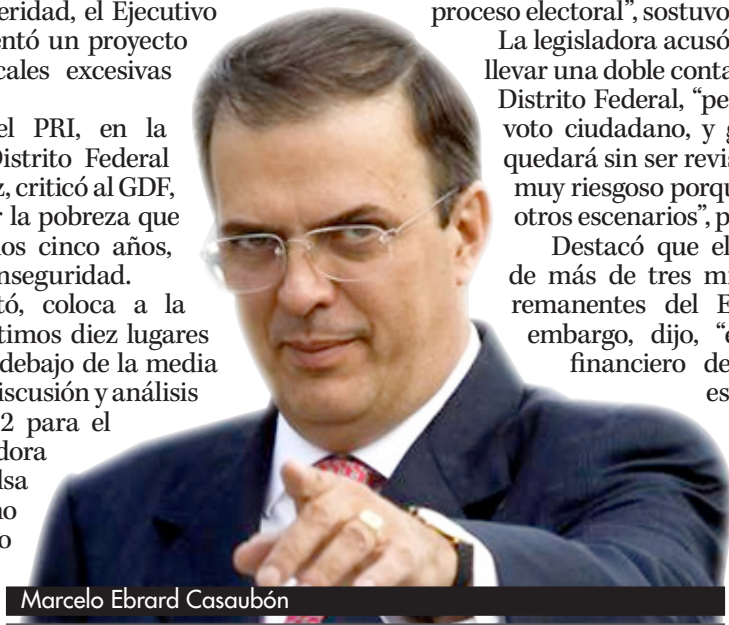
Marcelo Ebrard Casaubón

Destacó que el GDF tiene un superávit de más de tres mil 200 millones de pesos, remanentes del Ejercicio Fiscal 2010, sin embargo, dijo, "en la copia del balance financiero de junio y septiembre de este año ya desapareció tal remanente, pues el rubro correspondiente tiene valor de cero, como si de pronto se pudieran desaparecer, así nada más, tantos miles de millones de pesos".