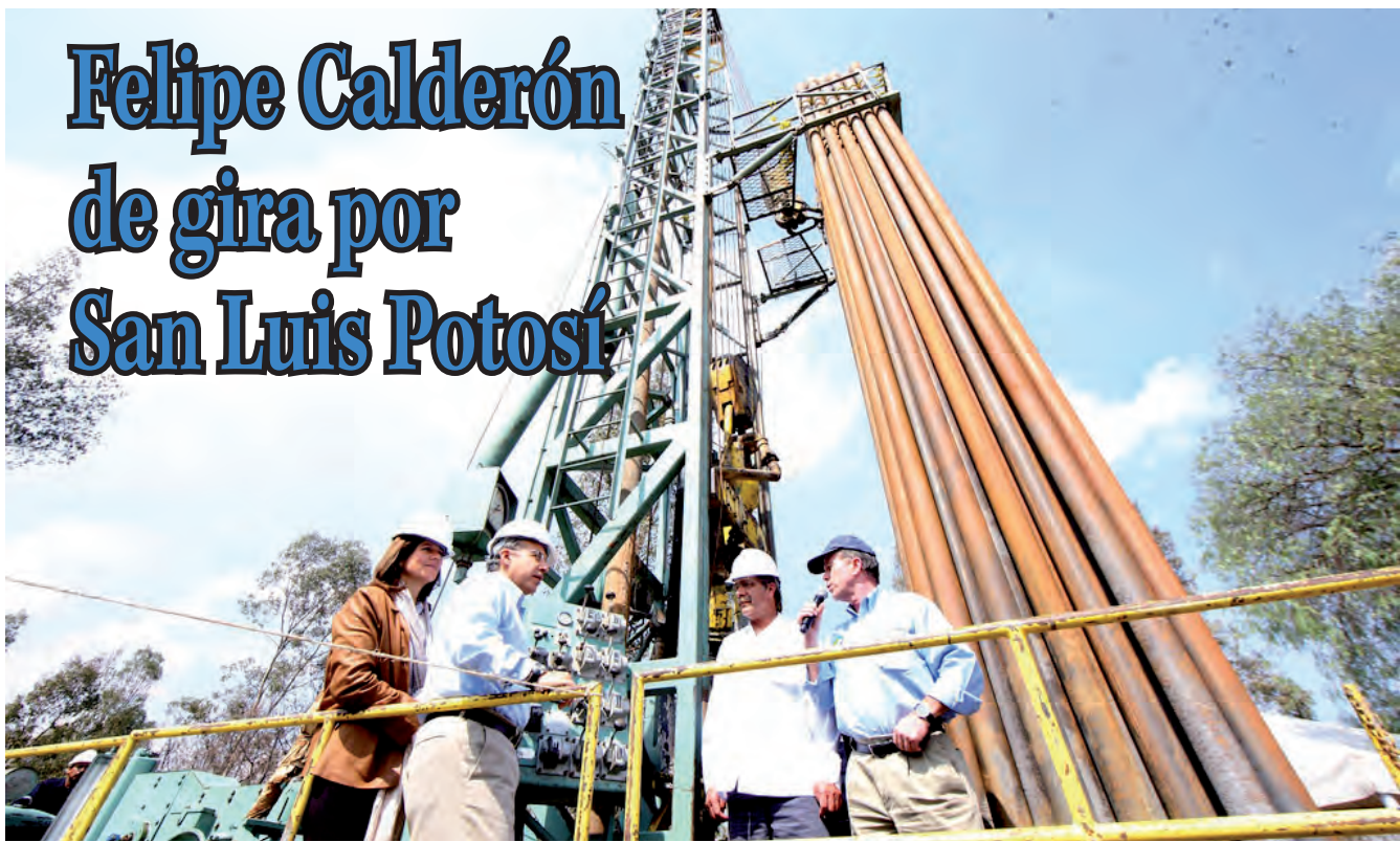
Felipe Calderón Hinojosa