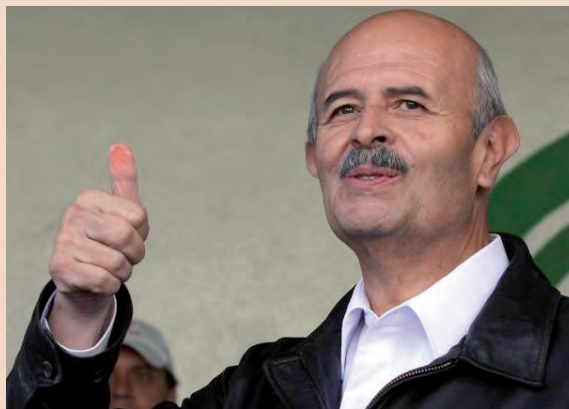
Fausto Vallejo Figueroa