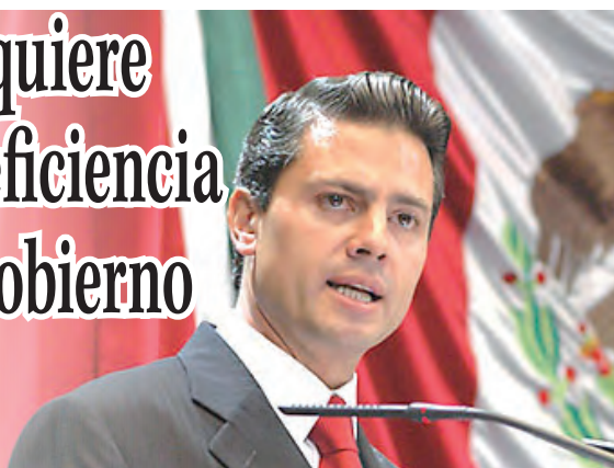
Enrique Peña Nieto