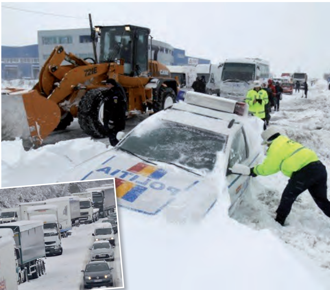
Estragos históricos por toda Europa a causa de onda polar; no se esperan cambios en las condiciones en los próximos días