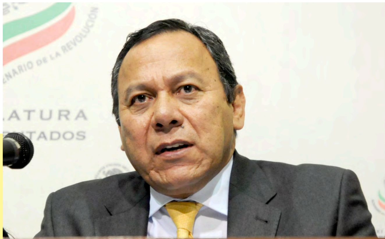
Jesús Zambrano Grijalva

"Esto nos da confianza en el Tribunal federal y también nos da la razón de lo que declaramos en días pasados, en el sentido que no veíamos elementos suficientes para tomar una determinación tan drástica y excesiva. Ahora hacemos votos para que el Tribunal Electoral de Michoacán, en lo sucesivo, tenga más cuidado en sus resoluciones y haga un