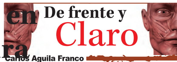
Caños Aguila Franco

“Es muy importante sembrar la semilla de la lectura entre los capitalinos, sobre todo en los niños y jóvenes, porque les ayuda a mejorar cómo les va en la escuela, porque mientras más lean, mejor les va a ir en sus calificaciones y podremos elevar la calidad de la educación”, dijo.