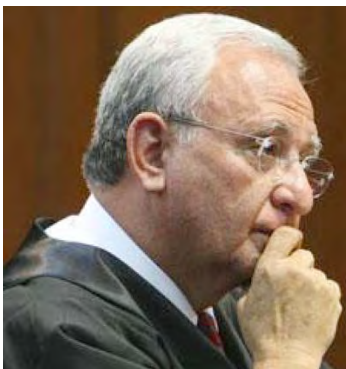
Juan N. Silva Meza

que el PJF cumplirá como órgano constitucional en las tareas cotidianas que se tienen, y habrá de estar presente en este tipo de eventos constitucionales con esa gran intensidad y trascendencia para la nación.