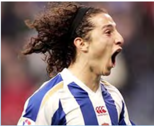
Andrés Guardado. De regreso.