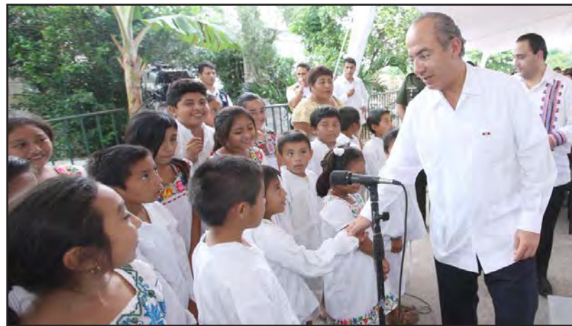
Felipe Calderón Hinojosa

El presidente de México indicó que se trata de una economía que genera empleo, que el año pasado creó casi 600 mil nuevas plazas. Además es una economía con baja inflación que a pesar del agudo incremento de los ‘commodities’ en el mundo y, sobre todo, de los alimentos y combustibles, tiene una inflación menor a cuatro por ciento, “por ahí de 3.5” por ciento, refirió.