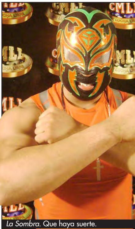
La Sombra. Que haya suerte.