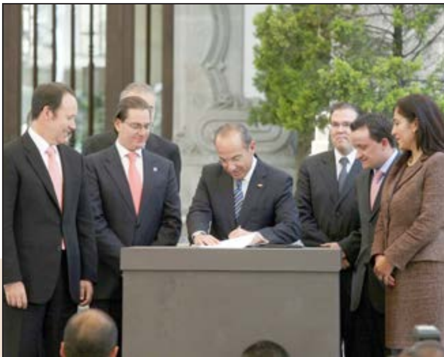
Felipe Calderón Hinojosa

Es decir, detalló, el anunciante que pretenda publicitar un producto o servicio