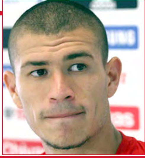
Enríquez. Justicia divina.