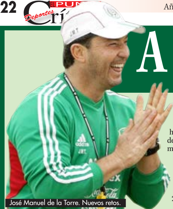
José Manuel de la Torre. Nuevos retos.

H OUSTON, Texas.- La Selección Mexicana inicia el presente año ante un fuerte rival, pese a quien le pese, ya que su similar de Venezuela ha crecido, y a pasos agigantados, por lo que el partido de hoy en el Reliant de esta ciudad texana le servirá de mucho al técnico azteca José Manuel "Chepo" de la Torre. Gracias a que no es fecha FIFA, "El Chepo" tendrá la oportunidad de observar a jugadores que militan en la liga azteca, así que acá resolverá algunas dudas para conocer a quién convocar para el preolímpico, así como para las eliminatorias rumbo a Brasil 2014.