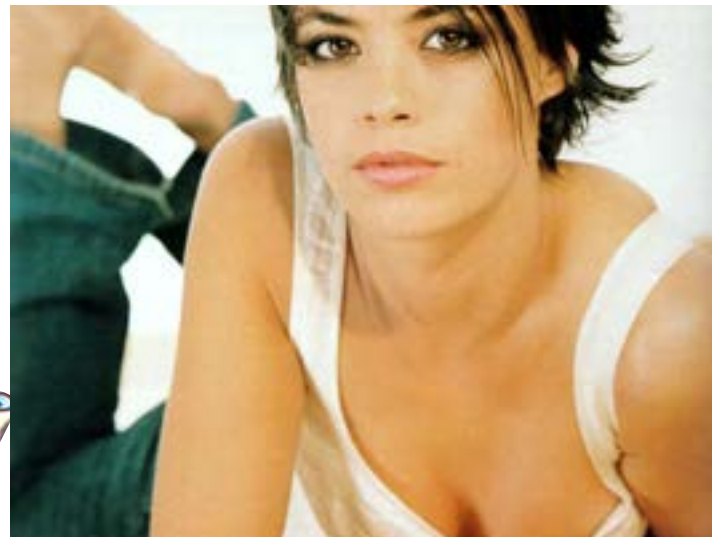
Bérénice Bejo en “The Artist”.

El artista nos habla de George Valentin, un actor de cine, quien imagina que la caída del cine mudo está por finalizar al arribo del cine sonoro, este filme está contextualizado en el año de 1927.