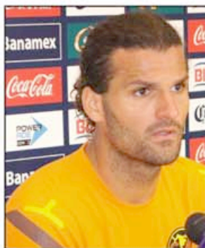
Vizcarrondo. No se desespera.