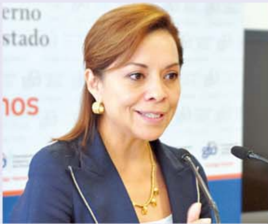
Josefina Vázquez Mota

En este marco, la aspirante a la candidatura presidencial agregó que enfrentará la contienda con fortaleza y dignidad y que está preparada para ganar la contienda interna y para derrotar a sus adversarios políticos, Andrés Manuel López Obrador y Enrique Peña Nieto.