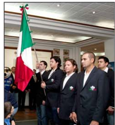
Yaquis va por el bicampeonato

En tanto, gracias a los aficionados y porque la Liga Mexicana de Beisbol (LMB) pretende darle mayor vida a este deporte en 2012, el logotipo de la liga fue renovado, por lo que ahora tiene una mayor fuerza por lo que ahora se dice llamar "Vive el Rey".