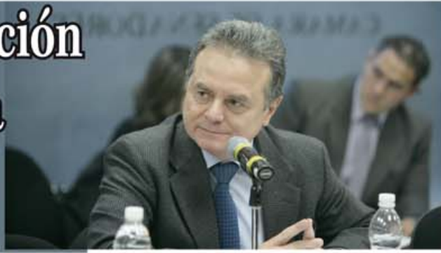
Pedro Joaquín Coldwell