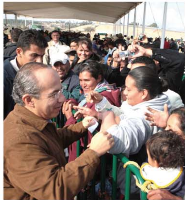
Felipe Calderón Hinojosa

El Presidente se refirió a la sequía que azota a nuestro país y de cómo el Gobierno Federal ha implementado una serie de medidas para combatir sus estragos, también habló de los Programas de Empleo temporal donde el Gobierno apoya a los más necesitados.