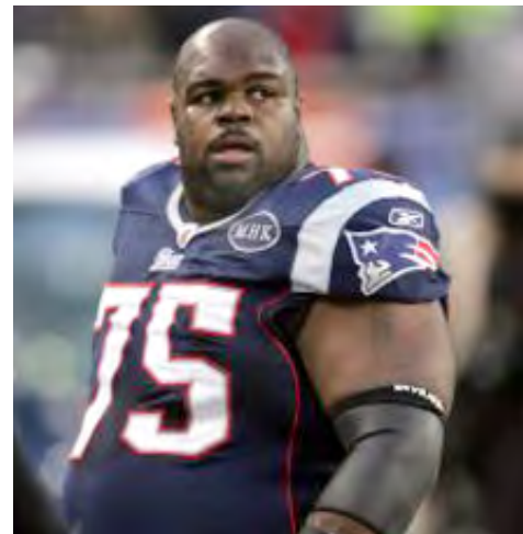
Pats o Gigantes. ¿Cuál podrá más?

Mientras que los Patriotas han reconocido que va ser un juego muy difícil, pero también importante, Vince Wilfork, tackle defensivo, reconoció la calidad de los Gigantes.