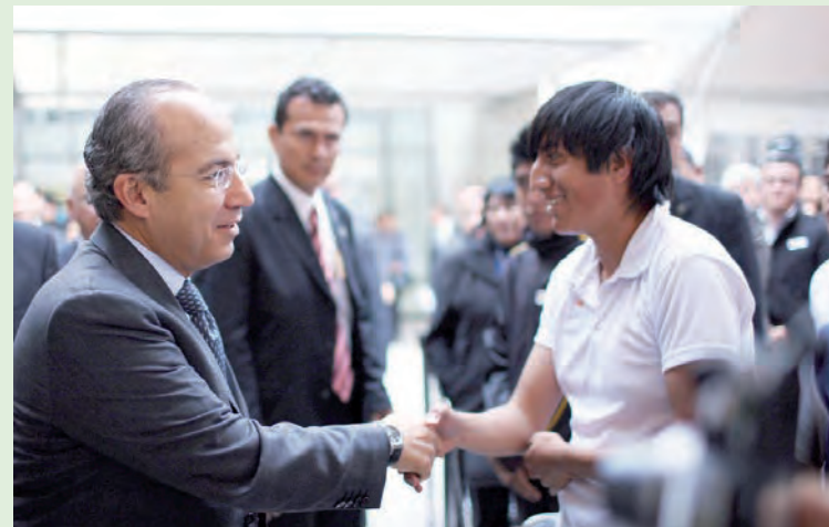
Felipe Calderón Hinojosa

"Se decía que mi administración no apoyaría la educación popular". Un apoyo de mil pesos mensuales a partir de marzo son en realidad un estímulo porque premian el mérito académico y el esfuerzo de los alumnos. El Presidente mencionó que una beca educativa es el principal generador de oportunidades de superación y sirve para reconstruir el tejido social porque abre oportunidades laborales y un futuro de bienestar a la juventud donde se afianzan mejores valores morales.