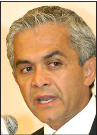
Miguel Ángel Mancera

La candidata del PAN al GDF, Isabel Miranda de Wallace, consideró que los gobiernos del PRD han mentido a los ciudadanos en materia de seguridad, pues la población vive con miedo de ser víctima de la delincuencia. Subrayó que el ex procurador Miguel Ángel Mancera, candidato "Juanito", "hizo lo que pudo para resolver este problema"... Por su parte, el delegado general del PRI en el Distrito Federal, Gustavo Cárdenas Monroy, consideró que la infraestructura deportiva ciudadana se encuentra "hecha pedazos", y dijo que tal motivo no se puede practicar ninguna actividad en sus instalaciones, y precisó que el tricolor luchará para que el uso de estos espacios de recreación sea gratuito, porque actualmente las autoridades cobran por su uso... En la ALDF, los diputados se preparan para realizar un periodo extraordinario de sesiones que se celebrará los días 8 y 9 de este mes.