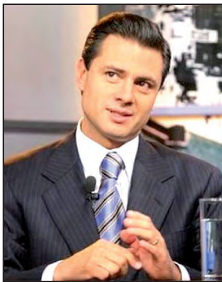
Enrique Peña Nieto

El aspirante apeló en ese sentido a la vocación democrática del gobierno y a su obligación de garantizar un proceso electoral limpio, equitativo y transparente, en el que se privilegie la propuesta de los candidatos para que la sociedad pueda realmente hacer la definición a través de su voto de quienes deberán ser sus autoridades.