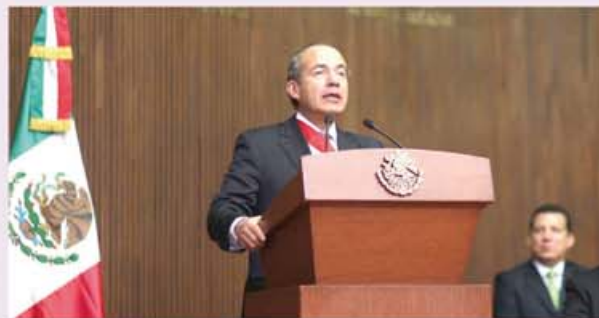
Felipe Calderón Hinojosa

En la fortaleza de las instituciones reside el pleno cumplimiento de la ley. Por eso, en el Gobierno Federal depura y profesionaliza a instituciones de seguridad, claves para la vida de la República, como son la Policía Federal, la Procuraduría General de la República y las fuerzas armadas. La fortaleza institucional que queremos para el país radica en la transformación de su marco jurídico. El Presidente expresó su reconocimiento a la labor realizada por el Poder Legislativo y por el Poder Constituyente Permanente en estos años. Porque gracias a la labor de legisladores federales y locales, en México se han aprobado reformas trascendentes e históricas de rango constitucional, como son la Reforma al Sistema de Justicia Penal, con lo que se transitó de un sistema inquisitorial a uno acusatorio y equitativo de carácter presencial, con juicios orales y públicos, y procesos simplificados, donde la víctima tenga un rol fundamental.