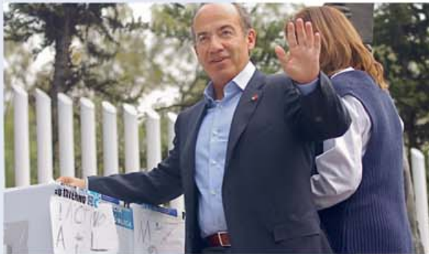
Felipe Calderón Hinojosa

Creel se pone a disposición de su partido