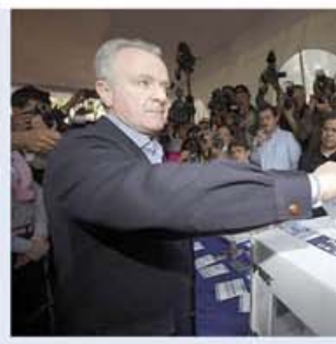
Ernesto Cordero Arroyo

Josefina Vázquez Mota fue electa candidata del PAN a la Presidencia de la República, dentro del proceso interno en el que participó junto con Ernesto Cordero Arroyo y Santiago Creel Miranda, informó la Comisión Nacional de Elecciones (CNE).