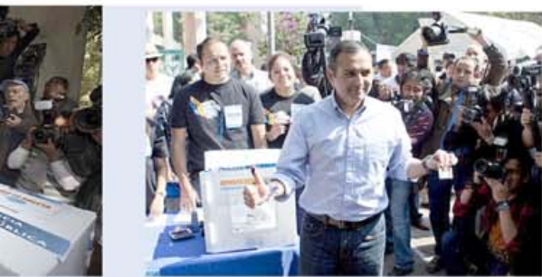
Santiago Creel Miranda

Por su parte, en conferencia de prensa en la sede nacional panista, Santiago Creel Miranda reconoció que no encabeza las preferencias de los panistas e insistió en que todo momento hizo una campaña limpia para ser candidato a la presidencia del blanquiazul.