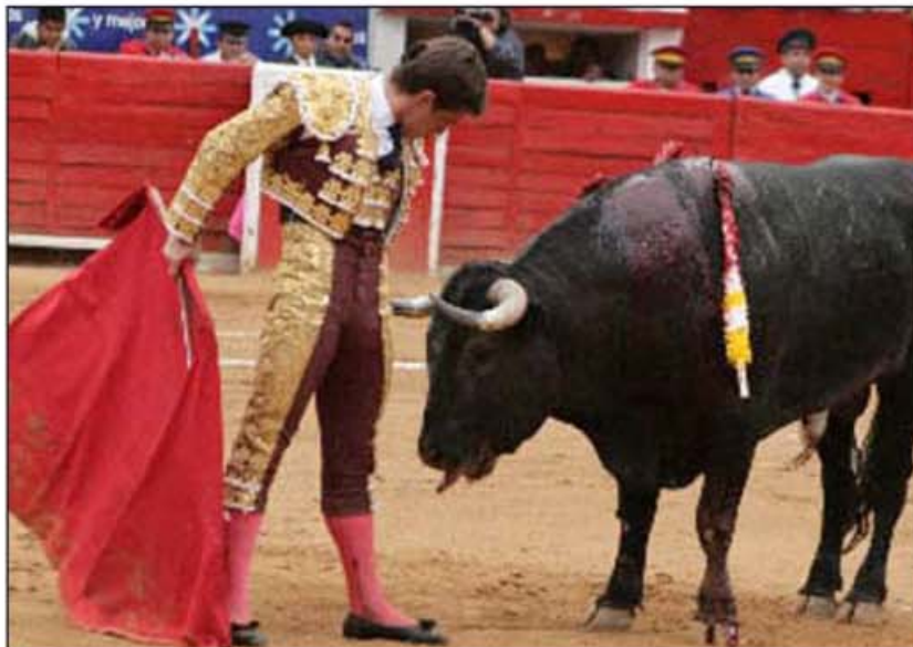
Julián López "El Juli"

y siempre artista, lució con cadenciosas verónicas y en ese mismo plan lo toreó con la pañoza, corriendo la mano y degustándose junto al toro. Una buena estocada, aunque trasera, por lo que recurrió