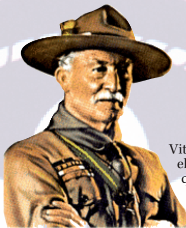
Baden Powell, fundador