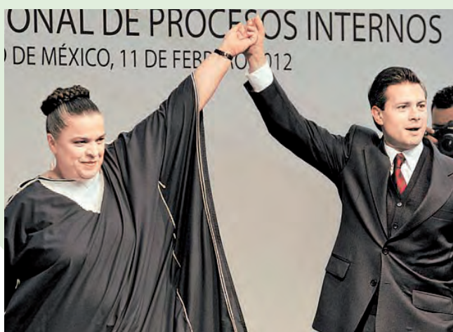
Beatriz Paredes y Peña Nieto

'Hoy en el PRI se cifra la esperanza de un mejor país para todos los mexicanos, el escenario de hoy es para que el tricolor asuma toda la responsabilidad ante esa confianza que la sociedad proyecta', estableció.