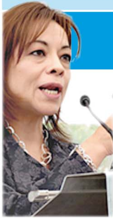
Josefina Vázquez Mota

Durante el acto desarrollado en el Estado de México, gobernado por el Partido Revolucionario Institucional (PRI), López Macías, pidió a la precandidata a la Presidencia, Josefina Vázquez Mota, depurar los Tribunales Agrarios debido a su alto índice de corrupción y que éstos, una vez que gane como jefa del Ejecutivo, se trasladen al Poder Judicial.