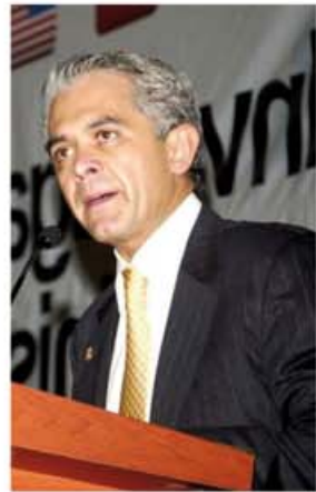
Miguel Ángel Mancera

"Solamente podemos asistir, como yo lo he venido comentando, solamente podemos estar como invitados, no se puede realizar ningún tipo de acto que tenga que ver con plataformas políticas, que tengan que ver con propuestas de trabajo, que tenga que ver con promociones de las fuerzas políticas que se representan", señaló el ex procurador.