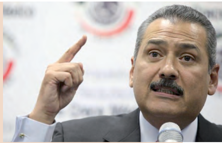
Manlio Fabio Beltrones Rivera

El coordinador del PRI en el Senado, Manlio Fabio Beltrones Rivera, insistió en "prevenir el uso partidista de las instituciones de justicia" y dar autonomía a la Fiscalía Especializada para la Atención de Delitos Electorales (FEPADE) a fin de que este organismo consolide la equidad, la legalidad y la transparencia.