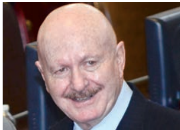
Manuel Mondragón y Kalb

Reprochó la falta de albergues veterinarios para animales rescatados, el número de elementos que resguardan y salvaguardan el orden en las inmediaciones de la Plaza México, aunque ésta debería ser pagada por los empresarios de la plaza, y pidió que se continúe con los avances en materia de seguridad.