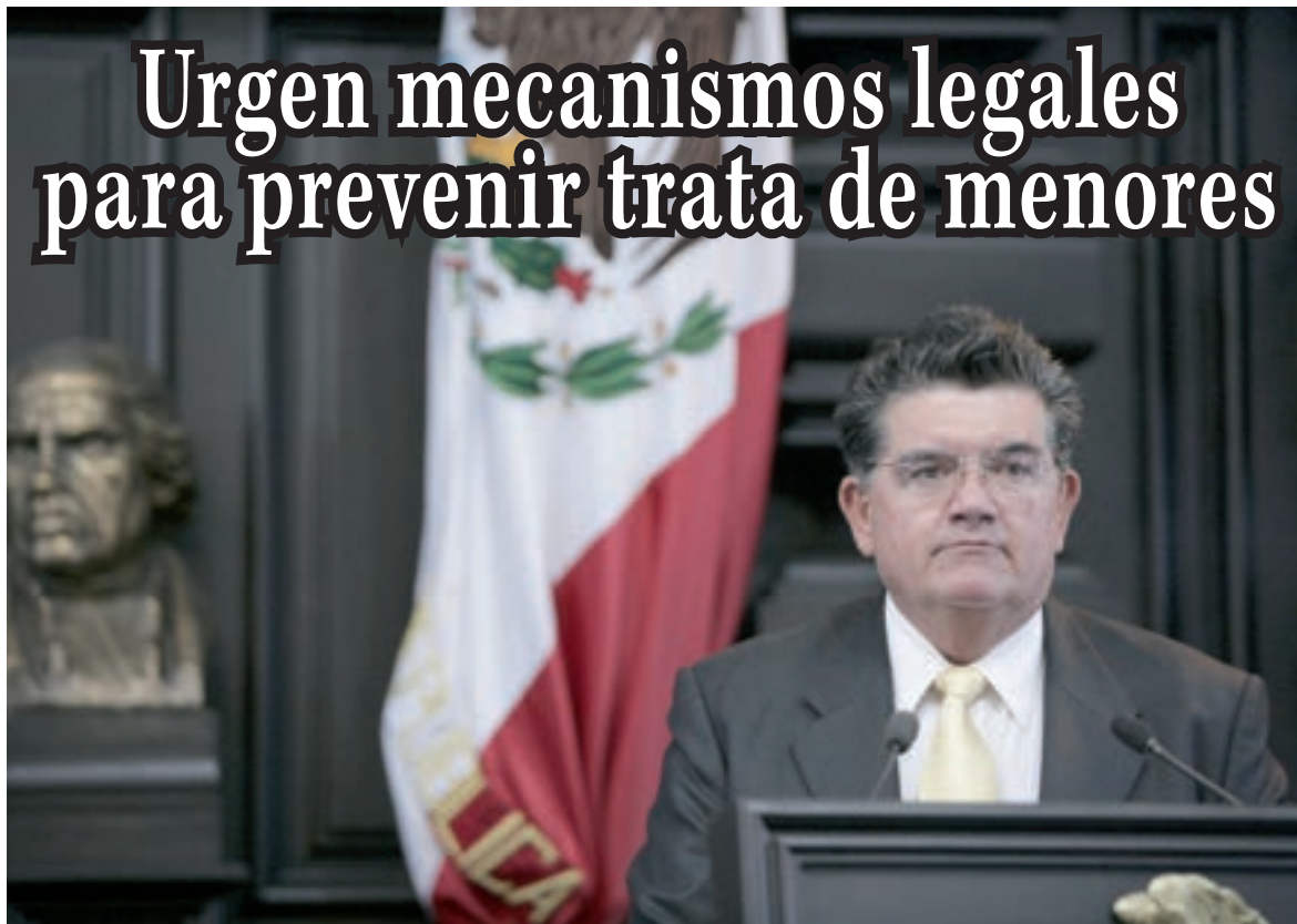
José Luis Máximo García Zalvidea

El senador José Luis Máximo García Zalvidea, integrante de la Comisión de Derechos Humanos, convocó a los legisladores a trabajar en mecanismos legales para prevenir la explotación sexual infantil y combatir flagelos como la pobreza, marginación, desempleo, desigualdad, ignorancia, adicciones o violencia, que son factores que propician la trata de personas.