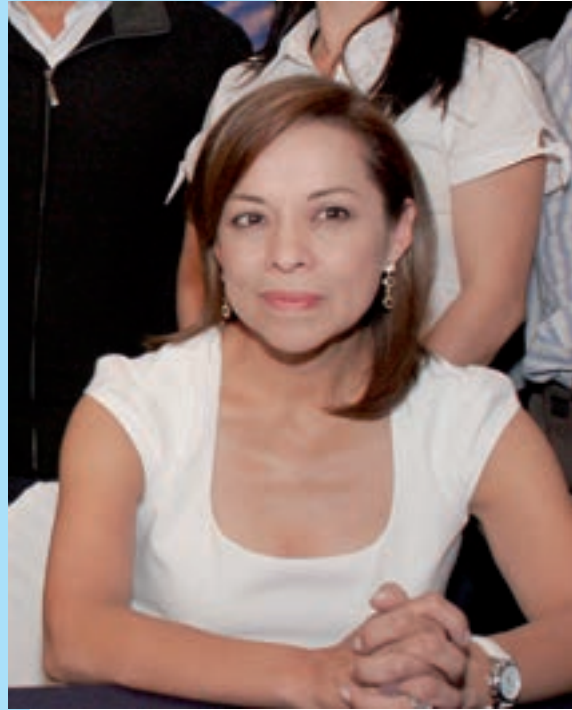
Josefina Vázquez Mota

Por otra parte, señaló que el equipo de campaña está preparado para tener una jornada exitosa y que el trabajo de proselitismo seguirá con las propuestas de la candidata, que será lo que la ciudadanía deberá