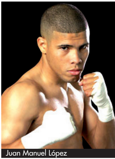
Juan Manuel López