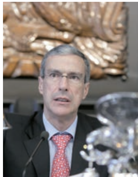
José González Morfín

El presidente del Senado de la República refirió que temas como las modificaciones legales para que los estados no contraigan deudas de manera descontrolada que afecten a su ciudadanía, deberán ser discutidos, pues en un plazo no muy lejano, el tema de las deudas estatales puede incidir en las finanzas del país, según han advertido diversos sectores.