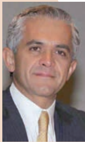
Miguel Ángel Mancera