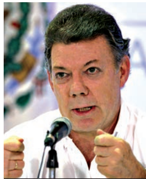
Juan Manuel Santos

También las áreas de "la cooperación judicial y el fortalecimiento de la capacidad técnica e institucional para combatir a la delincuencia transnacional organizada", agregó el mandatario, quien fue ministro de Defensa de 2006 a 2009.